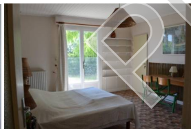
Châtaigne – 3p