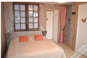
Capucine – 3p