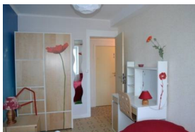
Coquelicot – 2p