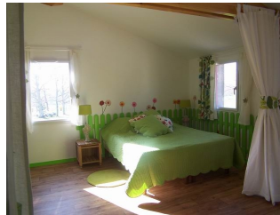
CHAMBRE A MOUTON – 1 a 4p