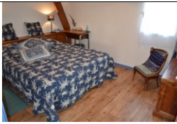
CELESTE – 1 à 2p

Céleste est née l'année de l'astronomie décrétée par l'UNESCO. Elle a pour parrain le ciel étoilé superbe par temps clair et pour marraine, l'histoire de Babar chère aux souvenirs d'enfance de Dovi. Les camaïeux bleus et bois confèrent à cette chambre une ambiance chaleureuse et douillette. La salle-de-bain marie le passé et le confort contemporain.