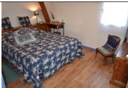
CELESTE – 1 à 2p

Céleste est née l'année de l'astronomie décrétée par l'UNESCO. Elle a pour parrain le ciel étoilé superbe par temps clair et pour marraine, l'histoire de Babar chère aux souvenirs d'enfance de Dovi. Les camaïeux bleus et bois confèrent à cette chambre une ambiance chaleureuse et douillette. La salle-de-bain marie le passé et le confort contemporain.