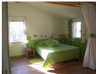
CHAMBRE A MOUTON – 1 à 4p